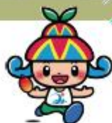
島の恵らイメージキャラクター 「あーや」