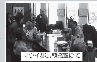
マウイ郡長執務室にて