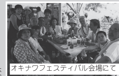
オキナワフェスティバル会場にて